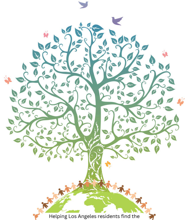
Helping Los Angeles residents find the resources to increase family income, establish financial security, and build academic success.